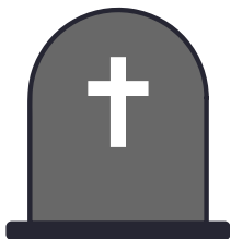
la cruz (las cruces)

Conocida por su intenso olor de color amarillo y tonalidades de naranja, es utilizada en las ofrendas de día de muertos.